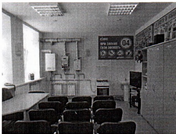
Рисунок № 2. Класс практического обучения