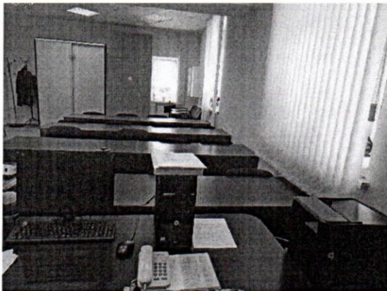
Рисунок № 1. Класс теоретического обучения