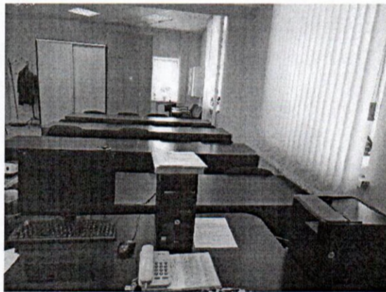
Рисунок № 1. Класс теоретического обучения