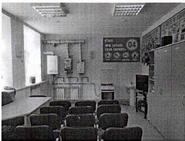
Рисунок № 2. Класс практического обучения