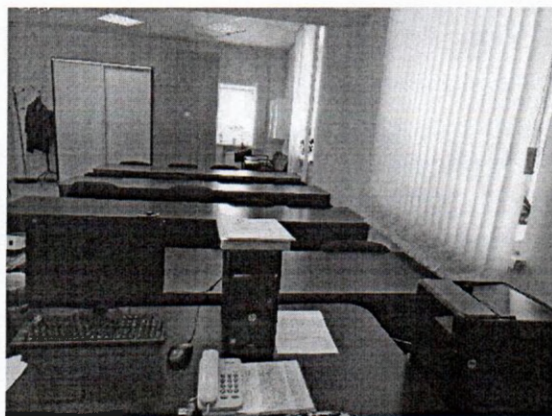
Рисунок № 1. Класс теоретического обучения