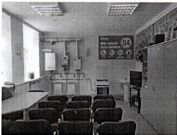
Рисунок № 2. Класс практического обучения