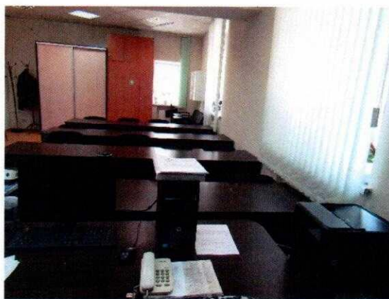
Рисунок № 1. Класс теоретического обучения