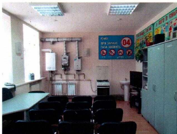
Рисунок № 2. Класс практического обучения