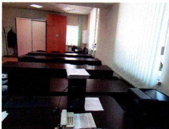
Рисунок № 1. Класс теоретического обучения