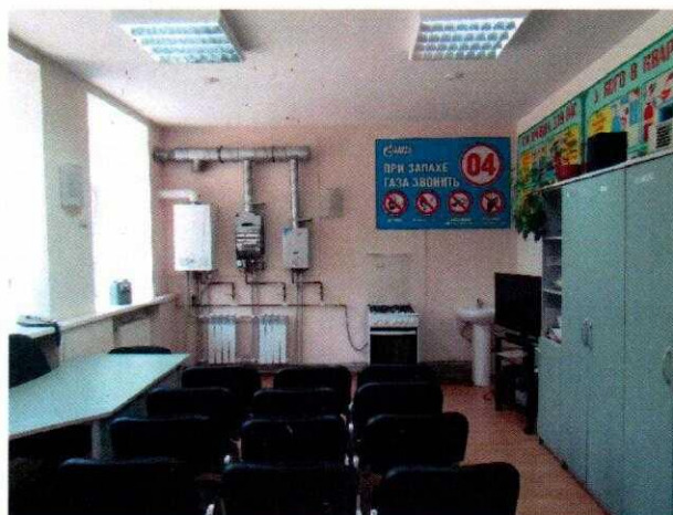
Рисунок № 2. Класс практического обучения