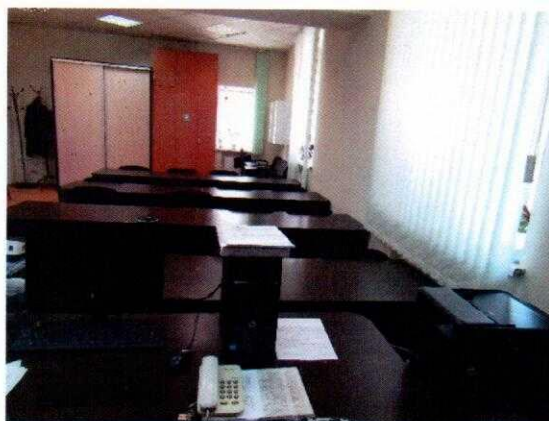
Рисунок № 1. Класс теоретического обучения