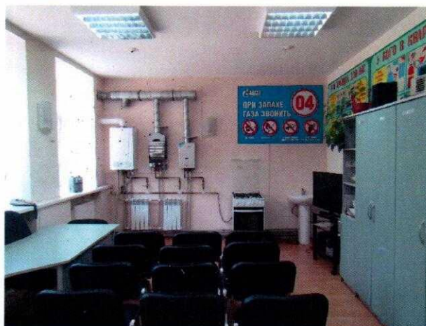
Рисунок № 2. Класс практического обучения