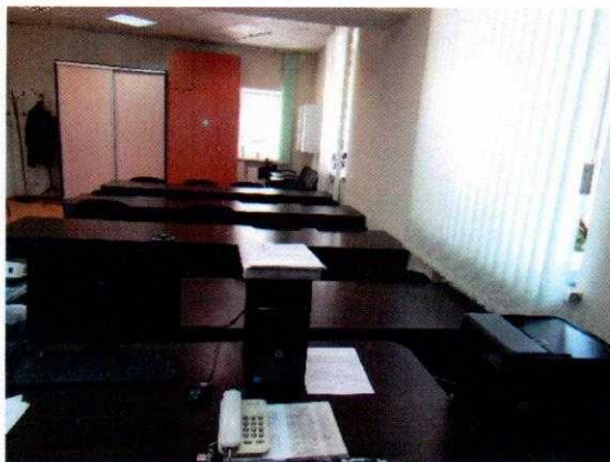
Рисунок № 1. Класс теоретического обучения