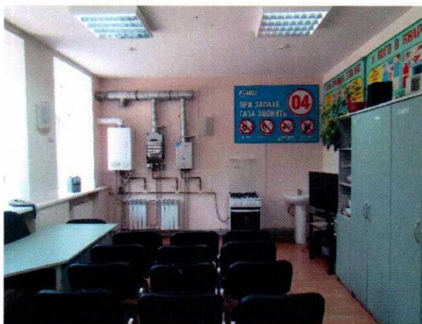
Рисунок № 2. Класс практического обучения