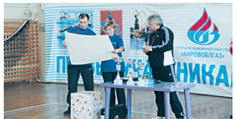
Спартакиада работников ОАО «Кировоблгаз», 2011 г.

Совместно с дирекцией профсоюзный комитет организовал и провёл летнюю спартакиаду и смотр художественной самодеятельности. В памяти 140 участников этого грандиозного мероприятия остались золотые стволы сосен санатория «Сосновый бор», предстартовые волнения, радость победы, торже-