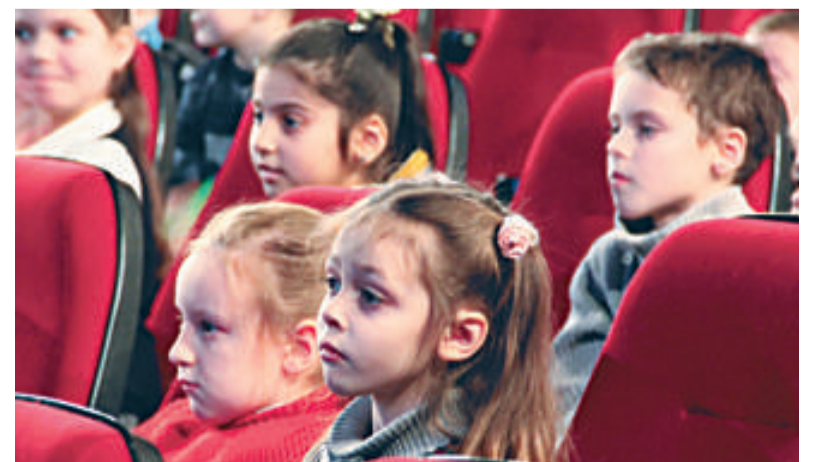
Дети внимательно следили за приключениями Газзи