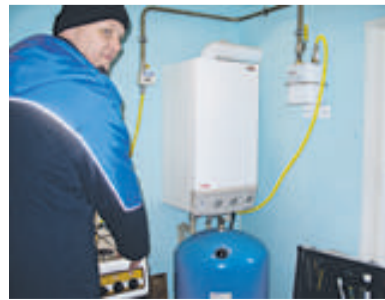
Подключение газового оборудования

В начале учебного года беседы о газе продолжились. Сотни ребятишек услышали, что может произойти, если не соблюдать правила безопас-