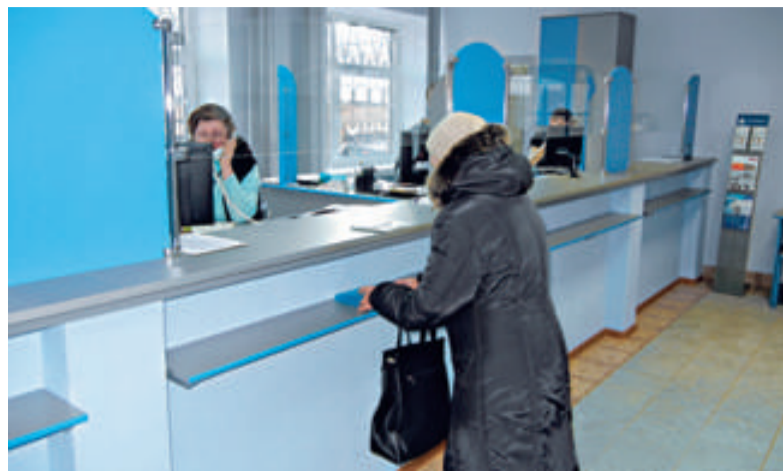
Новый кабинет абонентской службы КГФ