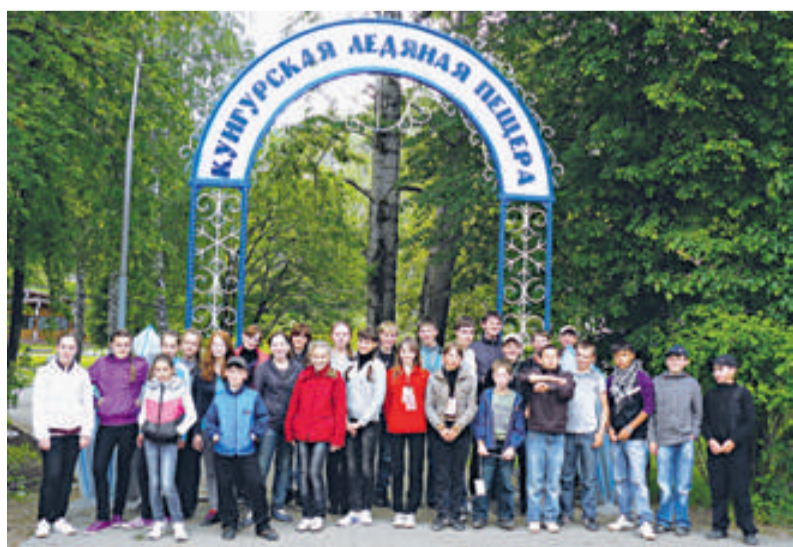
Детская туристическая поездка, г. Пермь

нами профсоюза, побывали в гостях у Деда Мороза в Великом Устюге, а летом такой же по численности компанией осмотрели пермские «Ледниковые Кунгурские пещеры». В преддверие Нового года 135 детей работников дирекции и Кировского городского филиала посетили кукольный театр. В Домах культуры всех районных центров, где расположены филиалы общества прошли незабываемые новогодние утренники, откуда почти 800 ребятишек ушли с подарками. Но самое отрадное, что профком никогда не забывает и о не самой счастливой части детворы, к коим относятся ребятишки Верховондонской школы-интерната. К Дню Защиты детей они тоже не остались без подарков.