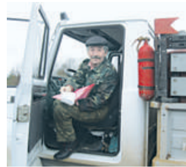
Подосиновский филиал. После рейса

Подосиновский филиал ОАО «Кировоблгаз» славен не только безаварийно и бесперебойно снабжает сжиженным газом население Подосиновского, Лузского и Опаринского районов, но и заботиться о здоровье своих сотрудников.