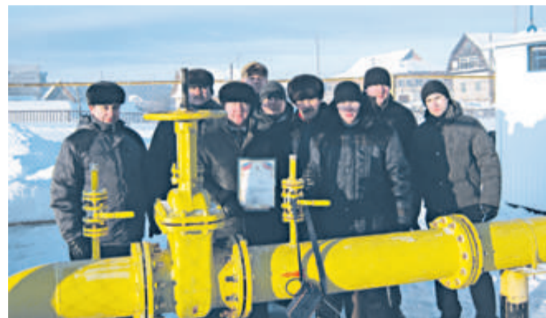
Пуск газа в Омутнинском районе

В канун нового года полностью завершена газификация микрорайона Малагово города Омутнинска. Протяженность новых газопроводов составила свыше 32 км. К 1451 частному дому подведёно самое дешёвое и экологически чистое топливо. Третья часть хозяев этих домов уже познала какое это чудо - природный газ.