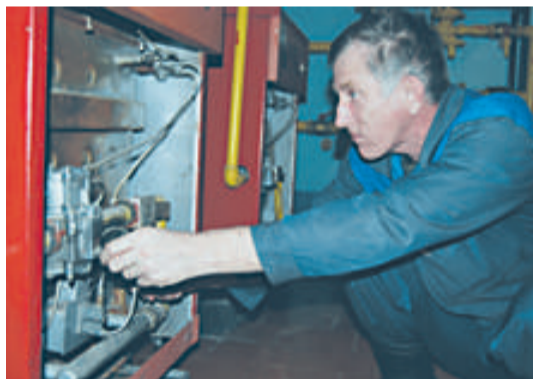
Ремонтные работы в теплогенераторной

И если пока там зувские газовики подключили к голубому топливу 23 частных дома, то в будущем возможно более интересное место приложения их сил. Поговаривают, что с приходом голубого топлива в село начнёт развиваться новый туристический центр - родовое поместье великих русских художников братьев Васнецовых. Тут без профессиональных навыков газовиков не обойтись. Тем более, что они обладают и опытом строительства: в 2011 году за счёт инвестиционной