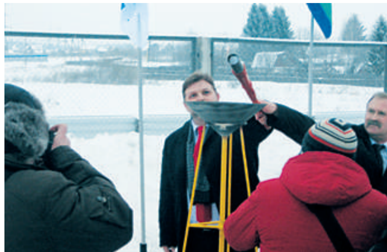
Пуск газа в Слободском районе. Присутствовал губернатор Н. Ю. Белых

лей благоустроенных квартир этих населённых пунктов стали чуток богаче: платят за газ сейчас меньше.