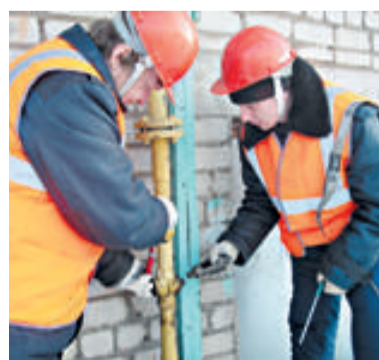
Проверка крана на вводе

Несомненно, значимым событием в жизни коллектива явилось активное участие лучших спортсменов в летней спартакиаде. В финале волейбольных соревнований среди мужчин янанчане одержали победу над кировскими волейболистами и заняли первое место. В соревновании по плаванию среди мужчин победу одержал