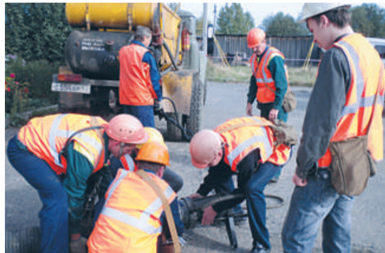
Общегородское тренировочное занятие